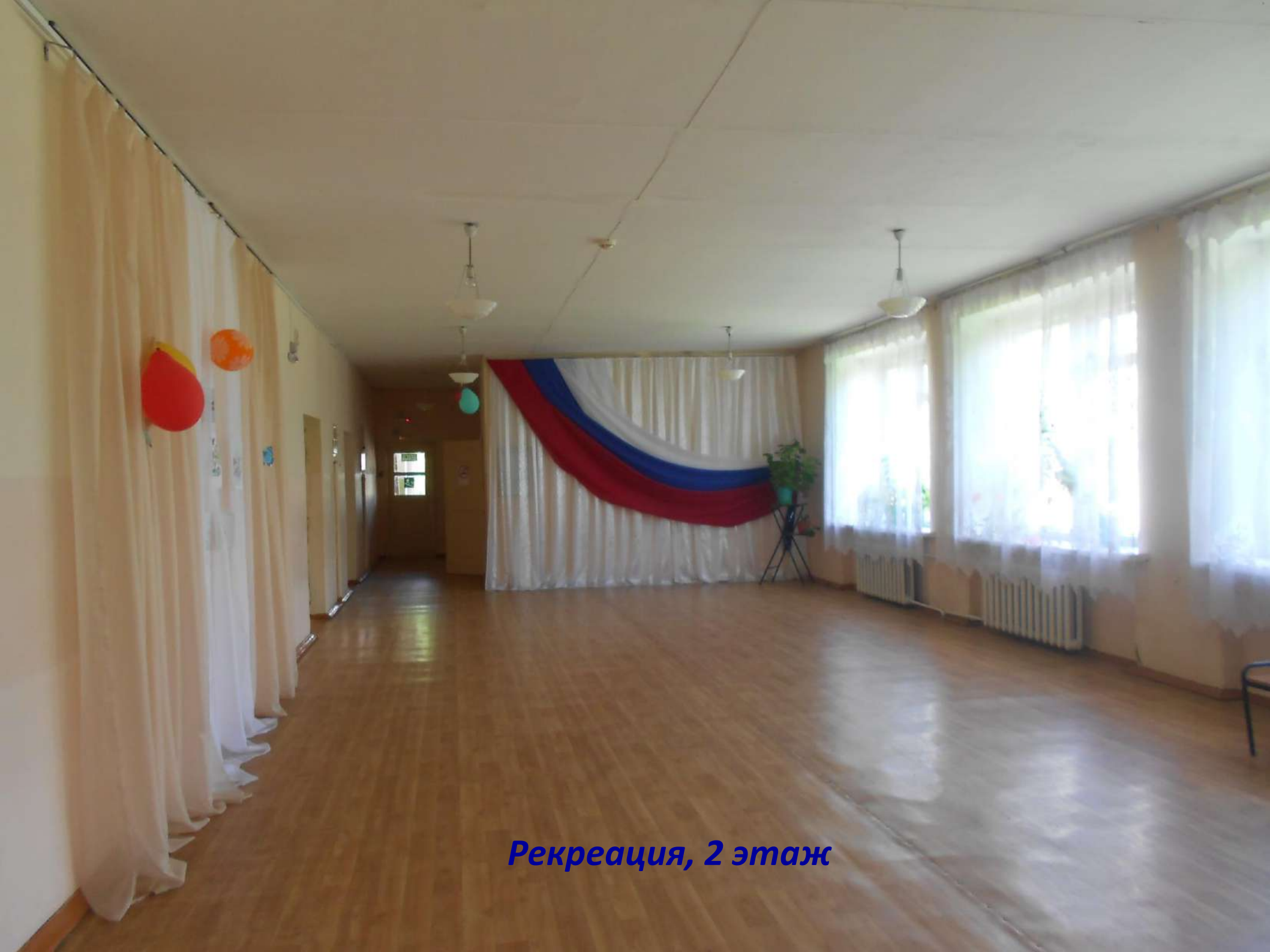
Рекреация, 2 этаж