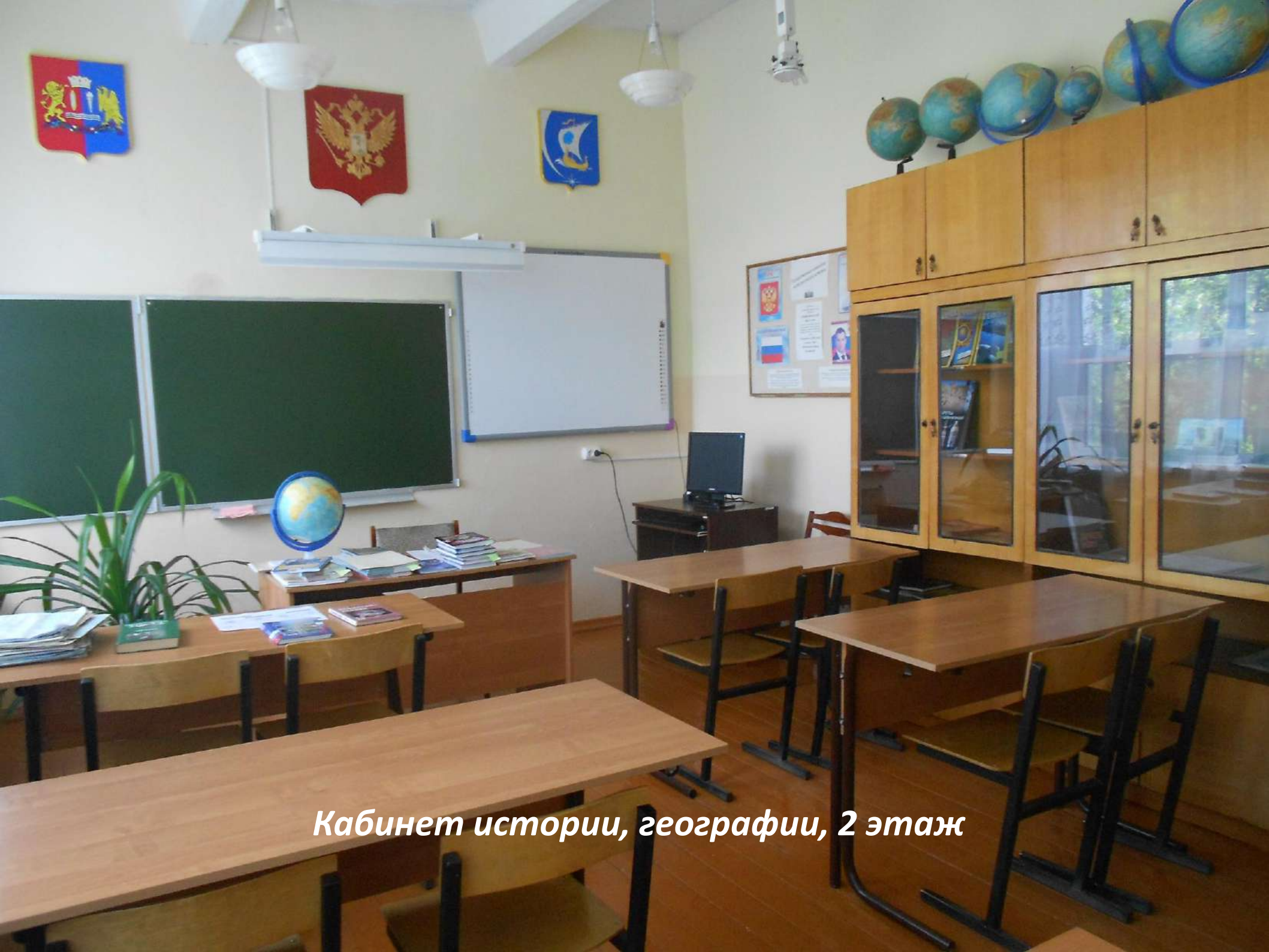
Кабинет истории, географии, 2 этаж