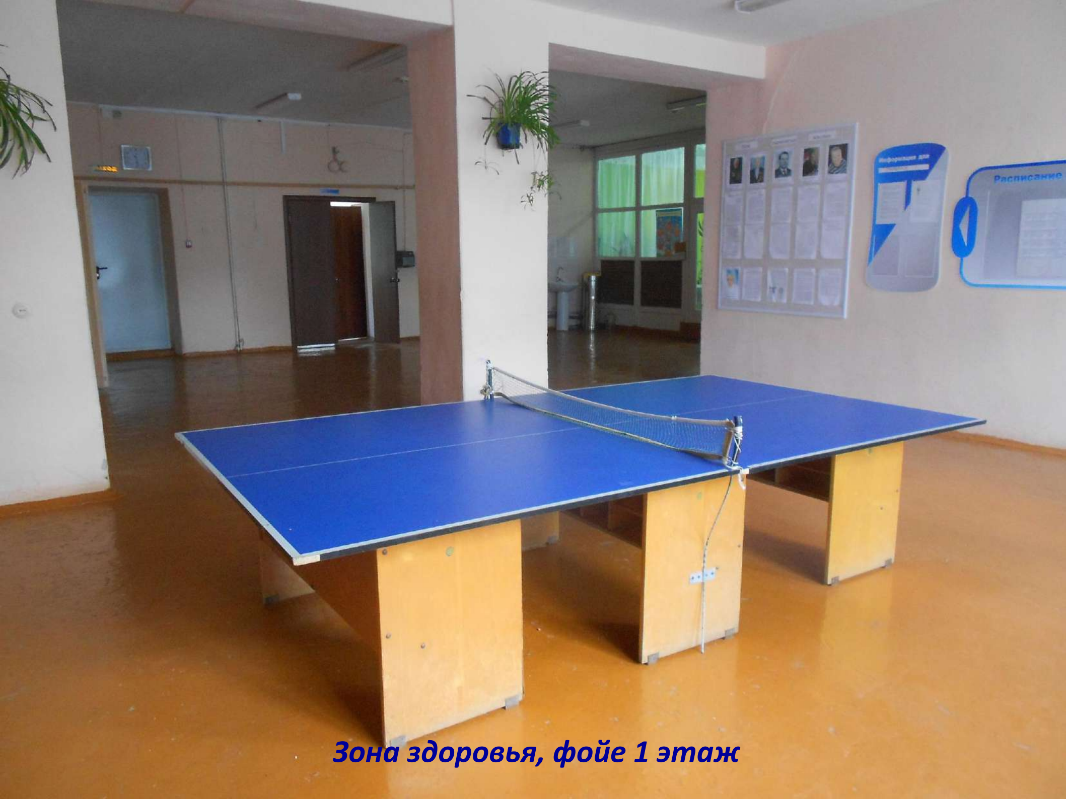
Зона здоровья, фойе 1 этаж