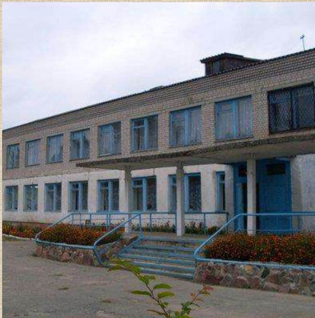
Муниципальное общеобразовательное учреждение «Илья-Высоковская школа»